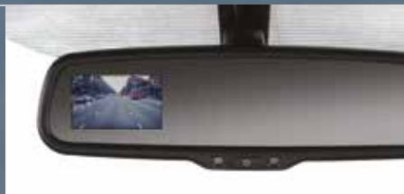
Cámara de reversa en espejo retrovisor