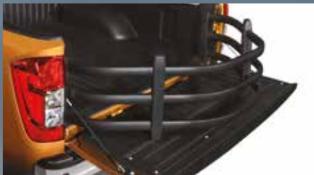
Extensor de caja

Equipa tu Nissan NP300 Frontier® con nuestra línea de Accesorios Originales Nissan.