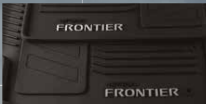
Tapetes de hule