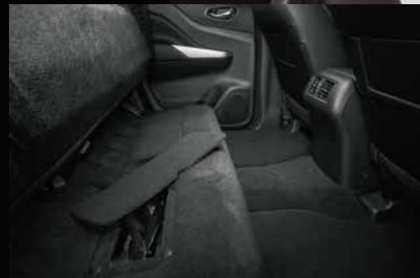
Compartimiento trasero debajo de los asientos