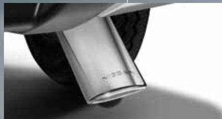
Colilla de escape