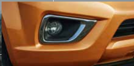
Faros de niebla