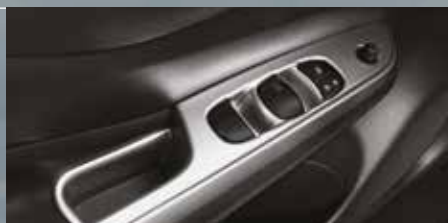
Molduras interiores en descansabrazos