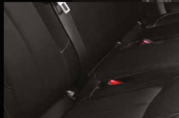
Sistema de anclaje para silla de bebé (ISO-FIX)