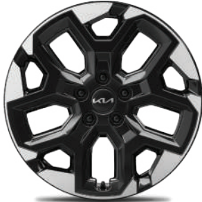
Rin de aluminio de 18" bitono EX, EX PACK