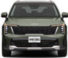
Jungle Wood Green (2)