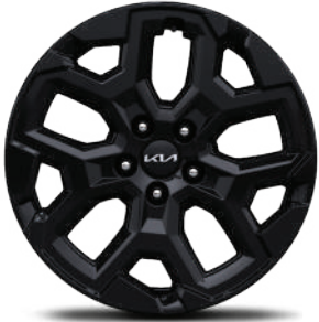
Rin de aluminio de 18" en acabado negro SXL