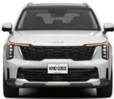
Glacial White Pearl