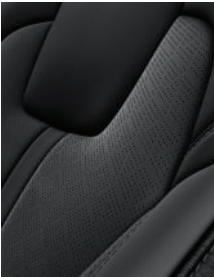
Piel artificial EX, EX PACK