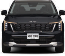
Pantera Metal Gloss